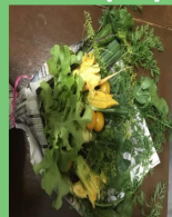
Готовый букет украшаем декоративными элементами