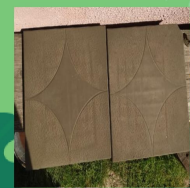
Изготовление тротуарной плитки