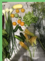
Подготовка необходимых продуктов для изготовления букета