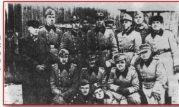
Старшины украинских батальонов на войсковых курсах в Минске, 1942 г.

На территории Беларуси гитлеровцы проводили политику геноцида - уничтожения групп населения по расовым, национальным, политическим и иным мотивам. Для поддержки оккупационного режима были созданы и направлены на территорию Беларуси украинские, литовские и латышские полицейские батальоны. Они охраняли коммуникации, сражались с партизанами, участвовали в массовом уничтожении еврейского населения, при этом отличались не меньшей жестокостью по отношению к местным жителям, чем гитлеровцы.