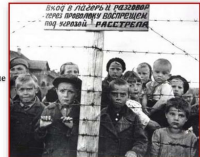
Дети в Освенциме

Даже детей нацисты принуждали выполнять непосильную физическую работу, морили голодом, помещали в концентрационные лагеря, вывозили на кааторные работы в Германию, брали у них кровь для своих солдат. За время оккупации гитлеровцы насильно вывели из Беларуси в Германию более 280 тыс. человек, в т.ч. более 24 тыс. детей. Вернувшись домой после войны только 160 тыс. человек. Всего во время оккупации в Беларуси погибло более 2,2 млн человек, почти каждый четвертый ее житель.