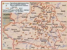
Карательные операции немецко-фашистских захватчиков на оккупированной территории Беларуси, 1941-1944 гг.

Нацисты провели более 140 карательных операций, в ходе которых сожгли около 5,5 тыс. населенных пунктов со всеми или частью жителей. В проведении карательных операций участвовали не только окранные дивизии и полицейские силы, но и кадровые военные, вооруженные танками, самолетами, артиллерией. Во время этих операций целые районы были превращены в «зоны пустыни».