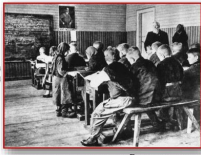
Урок в школе на оккупированной территории

Экономическое угнетение сопровождалось духовным. В системе школьного образования, действовавшей на оккупированной территории, учебный процесс имел прогерманскую и профашистскую направленность. В классе должен был висеть портрет А. Гитлера. Учителю, исходящему в класс, необходимо было приветствовать учащихся подтянутой правой рукой с возгласом «Хайль Гитлер!» или «Живе Беларусь». Ученики должны были также отвечать учителю. Перед началом урока проводились беседы о биографии Гитлера и его соратников, о жизни народов в Новой Европе, о победах вермахта.