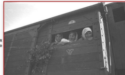
Вывоз мирных жителей в Германию

Одним из проявлений оккупационной политики был вывоз населения на принудительные работы в Германию. В рейхе таких людей называли «остарбайтерами» («восточными рабочими»). Людей насильно вывозили в товарных вагонах, по несколько дней они не получали пищи и сна. Захват населения занимались армейские части, жандармерия, отряды СС и СД, полиция. Были случаи, когда войска вермахта и полиция окружали деревни и забирал все население, а при оказании сопротивления расстреливали.